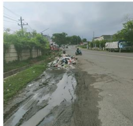
Bukti tindakan pelanggaran larangan Impor Sampah, Lokasi Simpang rimbo Kota Jambi.