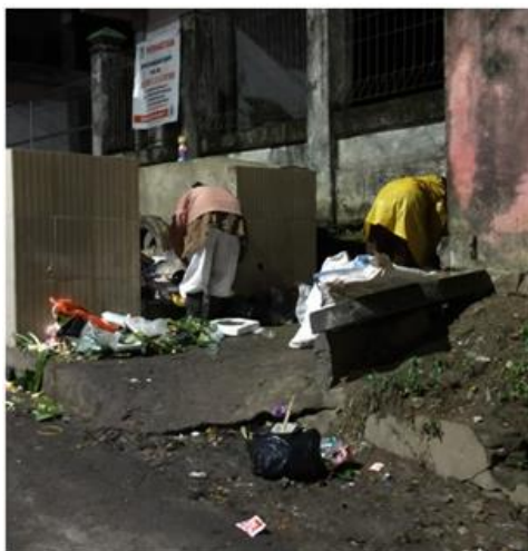
Tindakan pelanggaran terhadap larangan mengeruk/ mengais sampah di TPS Jln. Cokroaminoto Kota Jambi

Berdasarkan tabel di atas, terlihat bahwa dari 13 jenis larangan yang diatur Pasal 47 Perda Nomor 8 Tahun 2013, penerapan sanksi denda oleh DLH Kota Jambi baru diterapkan terhadap tiga jenis tindakan pelanggaran yaitu: (1) tindakan pelanggaran membuang sampah ke TPS dengan menggunakan kendaraan bermotor yang volumenya lebih dari 1 (satu) meter kubik, (2) tindakan membuang sampah di luar TPS/ tempat pembuangan sampah yang ditentukan, dan (3) tindakan membuang sampah di TPS di luar waktu yang ditentukan. Hal ini menjadi pertanyaan, apakah pelanggaran-pelanggaran yang terjadi hanya terhadap 3 hal tersebut?, tentu saja tidak. Karena berdasarkan observasi peneliti, selain tiga jenis tindakan di atas, tindakan pelanggaran-pelanggaran lainnya sering terlihat seperti pelanggaran terhadap larangan mengeruk atau mengais sampah di TPS selain oleh petugas untuk kepentingan dinas. Hal tersebut terlihat banyak dilakukan para pemulung. Padahal dalam Pasal 47 huruf i Perda Nomor 8 Tahun 2013 dengan tegas melarang setiap orang atau badan dilarang mengeruk atau mengais sampah di TPS, kecuali oleh petugas untuk kepentingan dinas. Ancaman denda untuk pelanggaran tersebut juga sudah dicantumkan, yaitu untuk ukuran 0,1 s.d 1 kg saja diancam denda Rp. 1.000.000,- (satu juta rupiah). Pelanggaran-pelanggaran tersebut terlihat di beberapa TPS di Kota Jambi seperti terlihat dalam gambar-gambar hasil penelitian berikut: