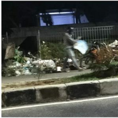
Tindakan pelanggaran terhadap larangan mengais sampah di TPS di Jl. H. Rahman Hakim.