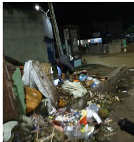
Tindakan pelanggaran mengorek /mengais sampah di TPS di Jalan Pattimura