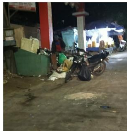
Tindakan pelanggaran terhadap larangan mengeruk/mengais sampah di TPS Kelurahan Rawasari Kota Jamb