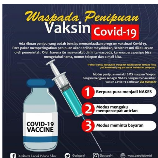
Gambar 1. Informasi Terkait Modus Penipuan SMS Vaksinasi Covid-19 Berbayar

Berdasarkan informasi yang dikeluarkan pada akun Instagram @ccicpolri (Direktorat Tindak Pidana Siber Bareskrim Polri) tanggal 1 Maret 2021, yang menyatakan bahwa terdapat saat ini ribuan pelaku kejahatan dengan melakukan tindakan penipuan terkait informasi vaksinasi Covid-19 melalui e-mail, telepon, terutama via SMS, yang contohnya terlampir pada gambar berikut.